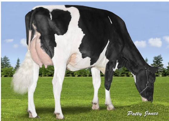
WALNUTLAWN ABBOTT BREEZE THIRD DAM